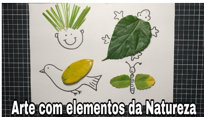
Arte com elementos da Natureza